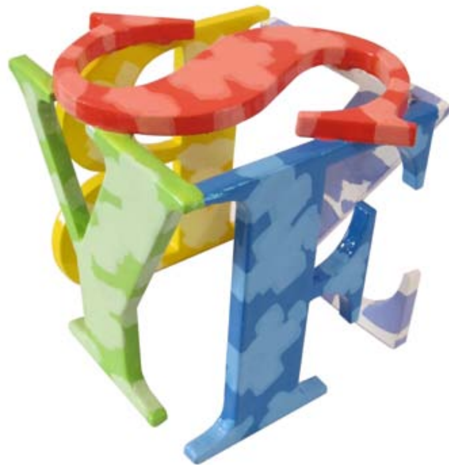
Refugio de la palabra. 2011. Acero pintado. 11 x 12 x 10,5 cm.