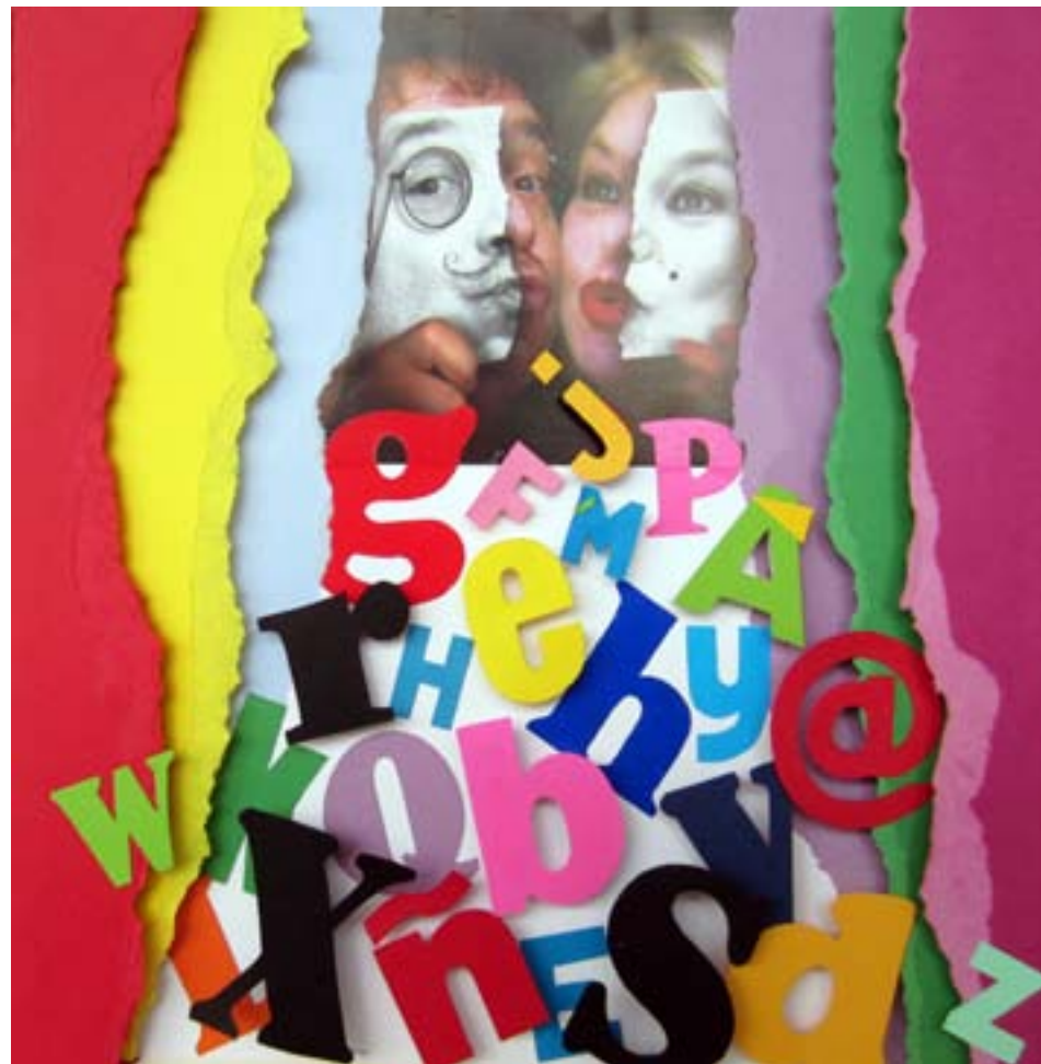
Deletreando III. 2013. 28 X 28 cm.