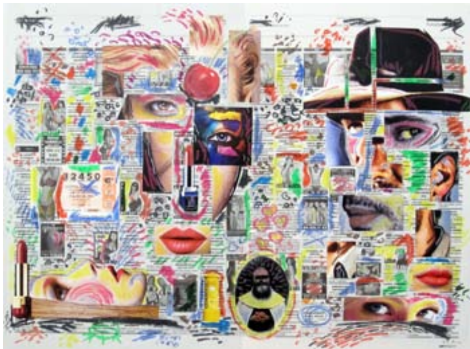
Sex o no sex I. 2008. Collage. 42 X 57 cm.