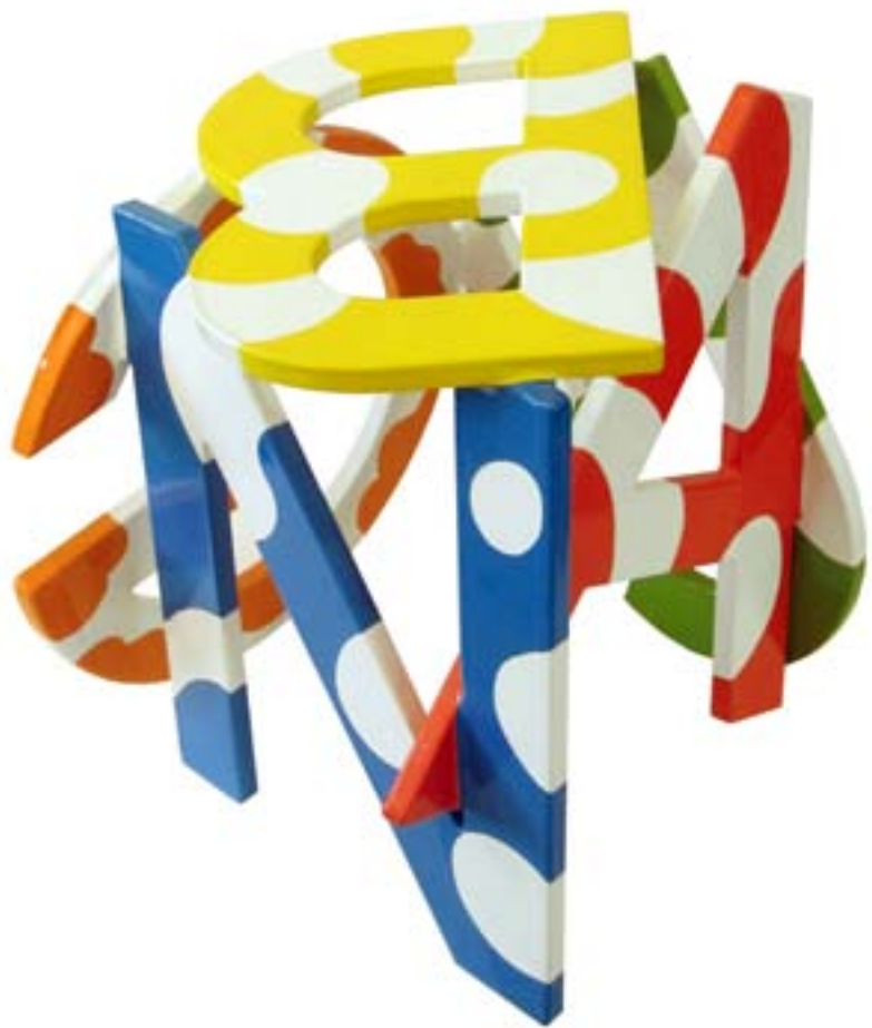
Refugio de la memoria. 2007. Acero pintado. 24 x 23 x 23 cm.