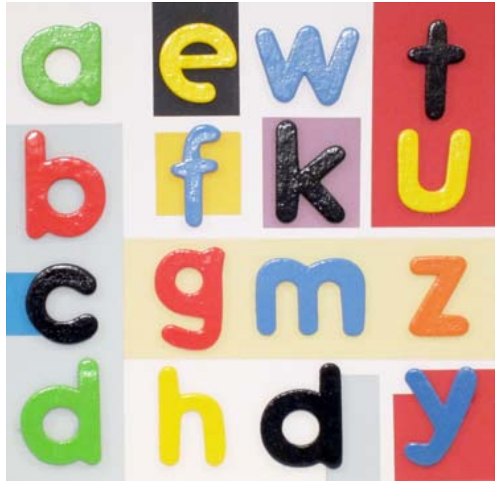
Deletreando V. 2013. 23 X 23 cm.