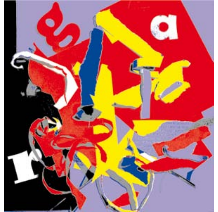
Juego de letras II.

Impresión digital. Papel Guarro Super Alfa 250 gr. Papel 55 x 38 cm. Mancha: 27 x 28 cm.