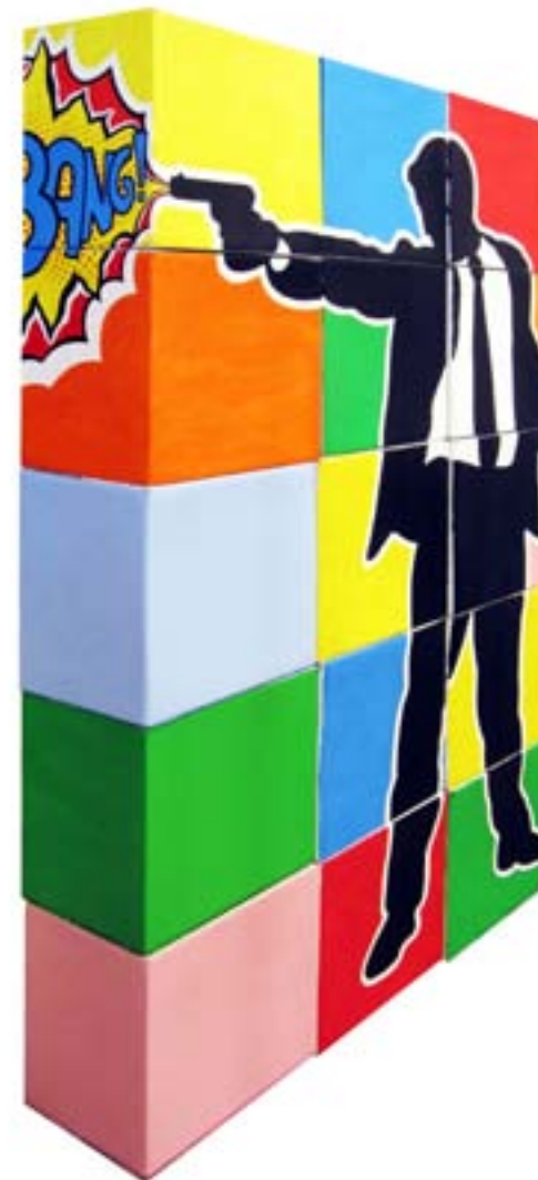
Big bang. 2013 Técnica Mixta. 158 x 98 x 23 cm.