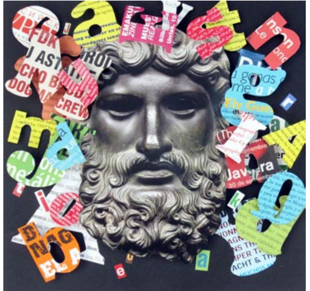
Deletreando IV . 2013. 23 X 23 cm.