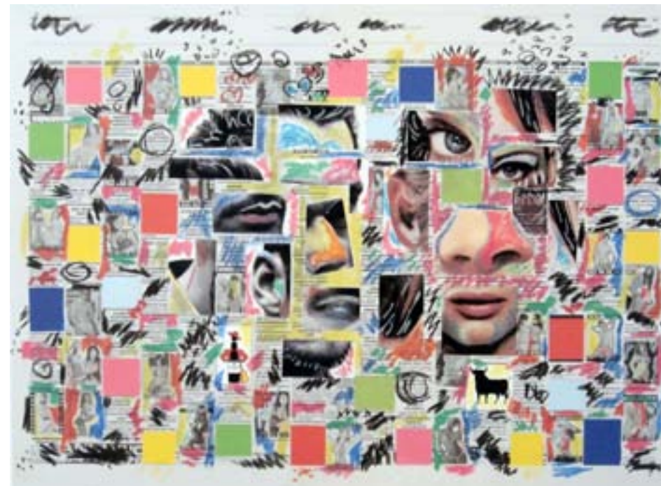
Body and soul. 2009 Impresión digital. Papel Guarro Super Alfa de 250 gr. Papel: 55,5 x 76,5 cm. Mancha: 40 x 55 cm.