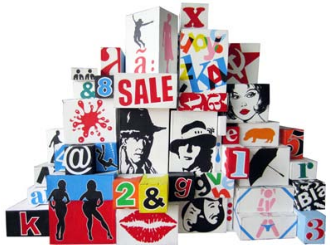
Cronicón. 2013 Técnica mixta. 110 x 158 x 57 cm.