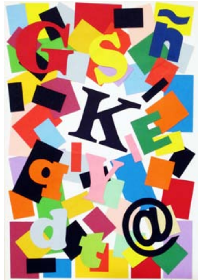
Allegro. 2013. 29,5 X 20 cm.