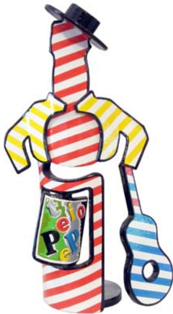
Tío Pepe. 2012 Acero pintado. 34 x 20 x 11,5 cm.