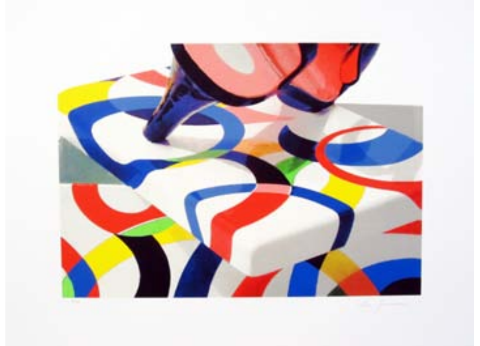
Taconeando. 2010 Serigrafía. Papel Guarro Basik 370 gr. Papel: 50 x 70 cm. Mancha: 35 x 50 cm.