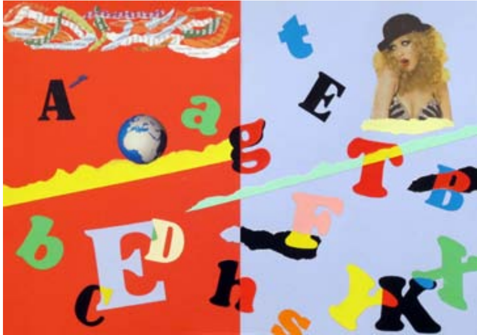
Gira mundo gira . 2012. 29 X 39 cm.