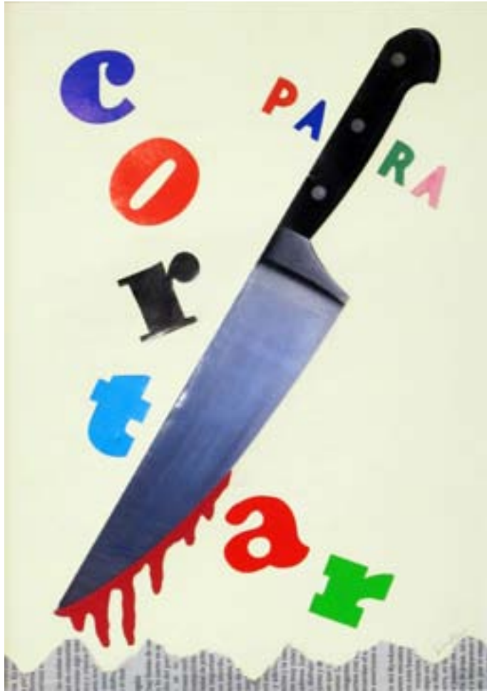
Para cortar. 2013. 29,5X 20 cm.