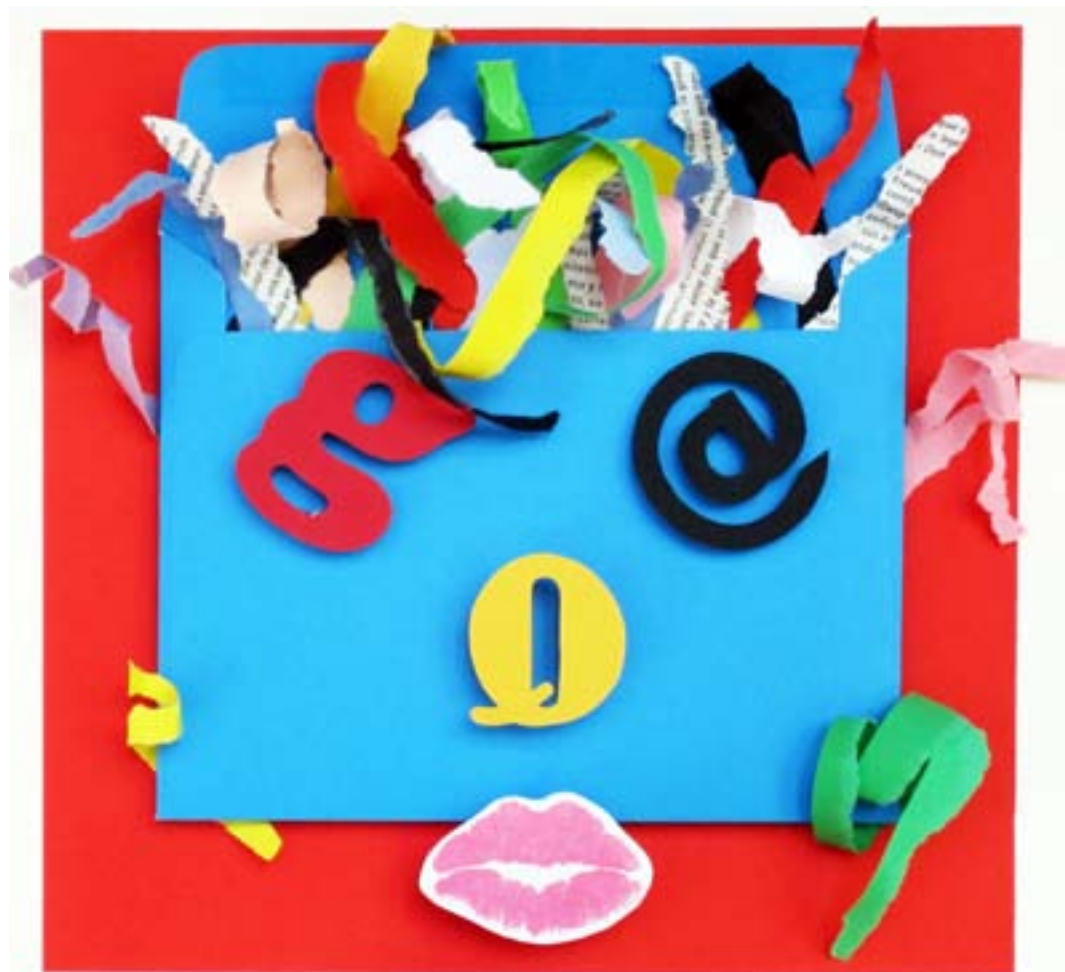
Deletreando II. 2013. 23 X 23 cm.