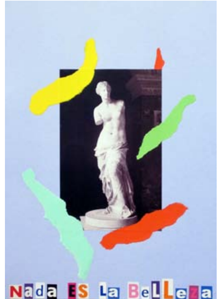
Nada es la belleza. 2013. 29,5 X 21 cm.