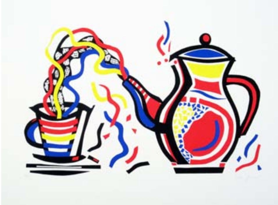
Aroma de café I. 2001 Serigrafía. Papel Guarro Super Alfa 250 gr. Papel: 50 x 70 cm. Mancha: 30,8 x 48,3 cm.