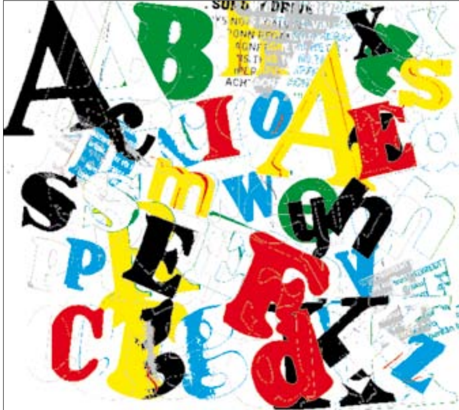
Juego de letras I.

Impresión digital. Papel Guarro Super Alfa 250 gr. Papel 55 x 38 cm. Mancha: 27 x 28 cm.